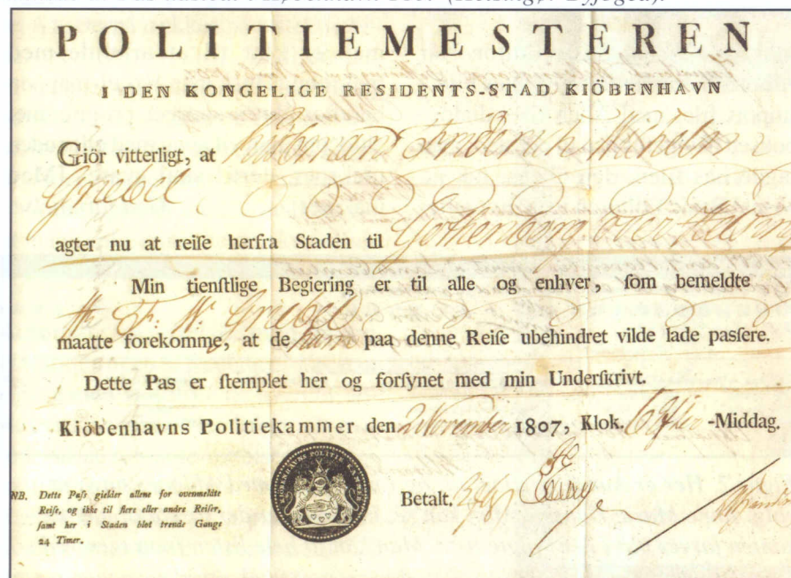
Billede 1: Pas udstedt i København 1807 (Helsingør Byfoged).

Fra København er materialet sporadisk bevaret, da myndighederne af pladshensyn har kasseret meget. Fra perioden 1788-1850 findes der københavnske pasregnskaber på Rigsarkivet under gruppen Reviderede Regnska-